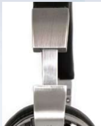
Die stabilen Bügel des Edition 8 bestehen aus massivem Aluminium. Die weichen Ziegenleder-Polster dienen dem Tragekomfort.

Von der geschlossenen Bauweise des Vorgängers Edition 9 (1/07) wich man bei dem in Tutzing am Starnberger See zusammengebauten neuen Hörer nicht ab. Sie spricht somit alle an, die ihre Umwelt nicht mitbeschallen wollen und sich von dieser auch etwas abschot-